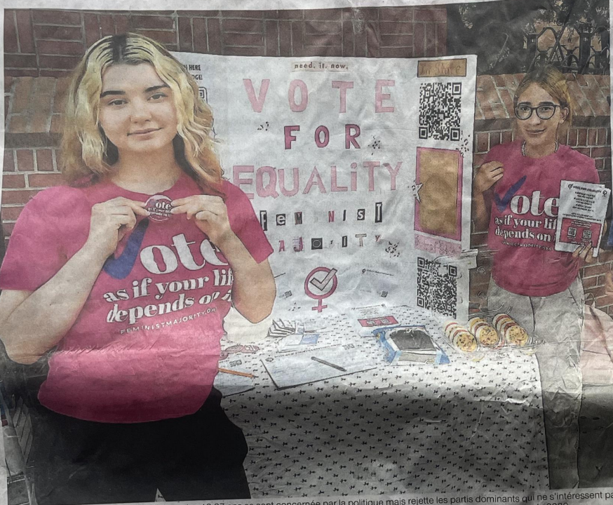
Reportage. Aux États-Unis, la génération des 18-27 ans se sent concernée par la politique mais rejette les partis dominants qui ne s'intéressent pas assez à leurs préoccupations. Ces jeunes pourraient voter en moins grand nombre à la présidentielle du 5 novembre qu'à celle de 2020.