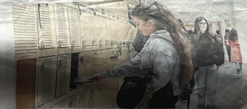
Une nouvelle étude livre des données alarmantes sur le temps d'écran des enfants et des adolescents. /ci, en mai dans un collège du Mortihau.