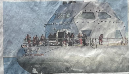
Un an et demi après le début du chantier, la station polaire Tara a été mise à l'eau à Cherbourg, vendredi. Reportage. En Mer