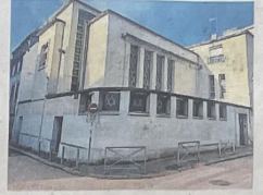
Lundi, un an après l'attaque du Hamas, la synagogue de Rouen, elle-même incendiée en mai, a ouvert ses portes pour une soirée hommage. (PHOTO OF)

Les policiers, qui sont intervenus rapidement, se sont retrouvés face à un homme armé d'un couteau et