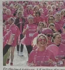
En dix-neuf éditions, 1,5 million d'euros ont été récoltés.

Grâce aux 65 000 € collectés lors de l'édition 2024, cinq projets ont notamment été soutenus. Parmi eux : l'amélioration de la prise en charge du cancer du sein par radiothérapie externe et inspiration bloquée au Centre François-Baclesse de Caen ; l'optimisation du traitement des cancers ovariens de stade avancé à l'aide d'un dispositif de vaporisation par plasma (plasmajet®) au CHU de Caen Normandie ; ou encore la lutte contre les effets secondaires de la maladie par l'acquisition de casques réfrigérés réduisant la perte de che-