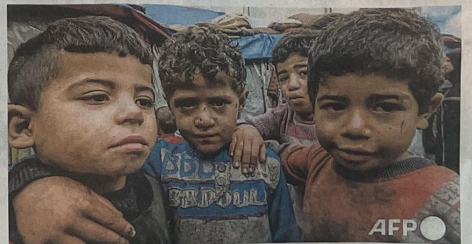
Des enfants palestiniens déplacés, posant le 14 mars 2024 dans un camp de Rafah, dans la bande de Gaza.

Sur les 20 photos de l'Agence France Presse (AFP) soumises aux 15 303 collégiens pour l'opération « Regard des jeunes de 15 ans », organisée dans le cadre du Prix Bayeux-Calvados-Normandie, celle de Mohammed Abed a reçu le plus de votes. Ce cliché immortalise quatre enfants palestiniens qui posent devant des tentes de fortune dans un camp de Rafah, à Gaza.