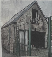
La porte du garage indépendant à l'habitation a explosé sous la force de l'incendie.

Les centres de secours de Valognes et Montebourg ont dépêché 17 soldats du feu ainsi qu'un infirmier du centre de Saint-Pierre-Eglise sur